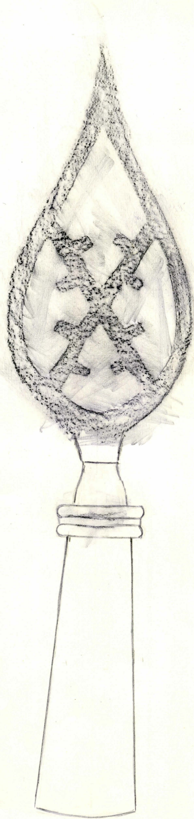
spets i nat.storlek